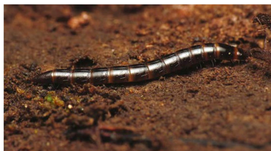
Megelőzi a drótféreg által a csövekben okozott károkat

A d 2 p rovarirtó technológia képes megvédeni a csöveket rovarok széles köre, így a tripsz, tücsök, drótféreg, és számos más rovarkártevő ellen. E csövek károsodásának megelőzése megtakarítja a vízpazarlást, valamint a javításokra és cserékre fordított időt és pénzt.